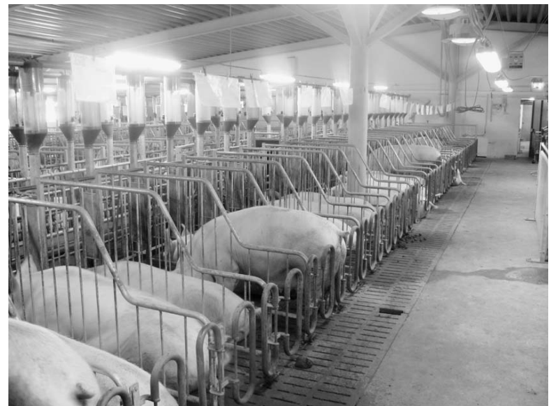
На свиноферме КФХ «Тоноян А.Э.»